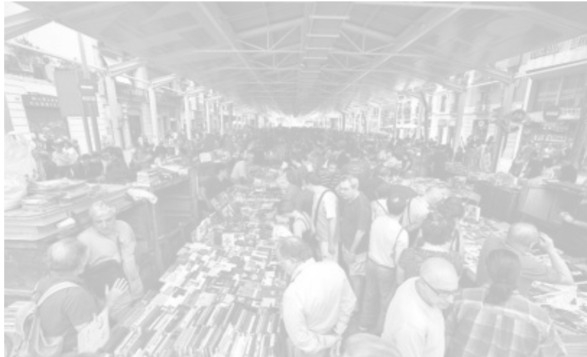
Aspecte del cobert sobre el carrer d'Urgell, entre els carrers de Tamarit i Floridablanca. / MARCEL·LÍ SÀENZ