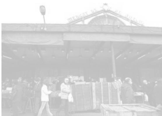
Els porxos de l'antic mercat de Sant Antoni, focus d'activitat.

És remarcable el planteig cru de la construcció de la coberta. Podríem dir que és un exemple d'arquitectura de pàgines grogues, en el sentit que no es deu tant a un disseny com a una tria de materials, uns càlculs i una idea organitzativa. Aquest és un aspecte que al meu entendre té un notable