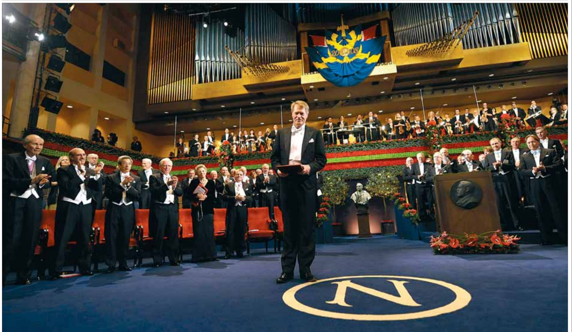
L'escriptor francès J.M. Le Clézio rep el premi Nobel de literatura 2008 durant la cerimònia d'entrega a Estocolm el passat 10 de desembre

Mercè Rodoreda i Agustí Bartra han estat els autors commemorats el 2008 en un any en què les editorials petites han enriquit el teixit de traduccions al català