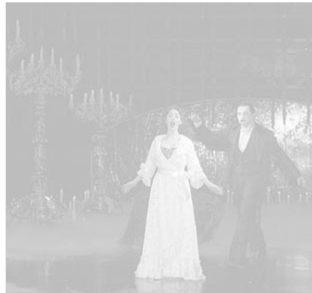
'El fantasma de l'òpera' és el musical que més vegades ha aixecat el teló a Broadway

Ha estat un any de premis a desconeguts o gairebé. El jurat del Nobel ens sorprenia amb un inèdit en català, Jean-Marie Le Clézio, de qui ja podem llegir L'africà , traduït a 62. El Man Booker el va guanyar Aravind Adiga, un indi amb una primera novel·la antisistema, El tigre blanc , que ha editat Amsterdam. Es confirmava així, un cop més, que en literatura no tot són faves comptades. ■