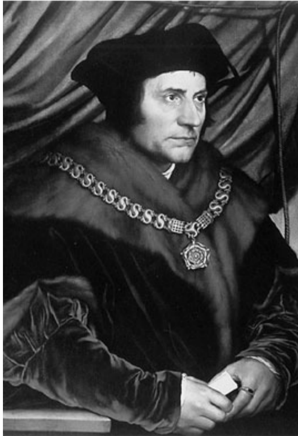
Retrat de Thomas More, obra de Hans Holbein.

L'autor de la traducció d' Utopia fa, en la introducció, un retrat de More proper al panegíric. El qualifica «d'humanista de gran volada, un polític complet i un cristià conseqüent fins a la mort, en el sentit més literal i tràgic de l'expressió». I és que More (Londres, 1478-1535), després de rebre una més que sòlida formació, va iniciar la seva carrera política el 1504, que el va dur a ser membre de la Cambra dels Comuns, membre del consell privat d'Enric VIII el 1518 i, finalment, can-