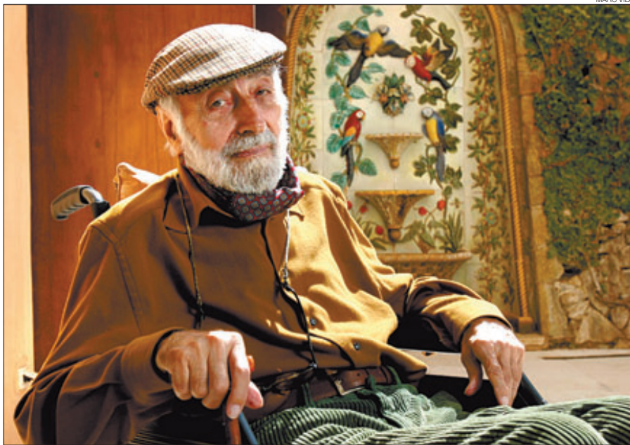
► Josep Palau i Fabre, el 2005, a la Fundació Palau de Caldes d'Estrac.

La Fundació Palau de Caldes d'Estrac i Galaxia Gutenberg / Círculo de Lectores han fet pública l'ambiciosa convocatòria del primer Premi Internacional d'assaig Josep Palau i Fabre, amb una dotació de 10.000 euros, que es decidirà el 23 de febrer de l'any que ve i al qual es podrà concursar en qualsevol llengua, «una opció que té tot el sentit si es té en compte que l'obra assagística de Palau està escrita en català, castellà i francès», com va recordar el president de la Fundació Fabra, Tomàs Nofre. El mateix Nofre també va revelar que queda encara per publicar un dels assajos que Palau va dedicar a Picasso. L'inèdit, que possiblement aparegui a l'editorial Polígrafa –com els seus antecessors– recull la trajectòria del pintor des dels seus primers passos en el cubisme fins a la plenitud del Guernica . «El text de l'assaig ja està complet i acabat, només