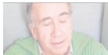
JOAN MARGARIT PREMI NACIONAL DE POESIA 2008