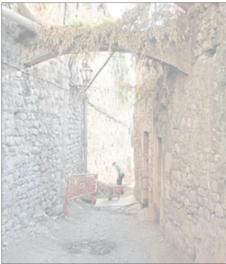
A l'esquerra i a dalt a la dreta, les actuacions que s'estan realitzant a la zona antiga protegida de la vila. A sota, les adequacions de la segona fase de Cal Tronc per convertir-lo en un centre cultural polivalent.

D'altra banda, Besalú també ha iniciat la segona fase de les obres de reforma de l'antic cinema i teatre de Cal Tronc per donar pas a un centre cultural polivalent. Aquesta obra, pressupostada en gairebé un milió d'euros, té un termini d'execució de 8 mesos i s'espera que es pugui inaugurar el setembre de 2009. Les millores de la primera fase s'enllestiran amb la restauració de l'edifici, la millora de la sala i l'escenari, i l'habilitació d'un espai polivalent.